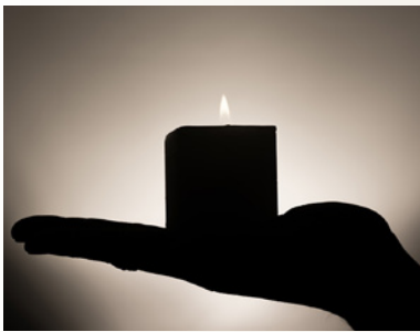
※イメージ写真(展示予定作品ではありません)