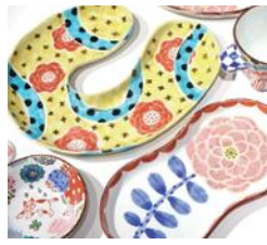
今村公恵 陶展 ukiuki2026