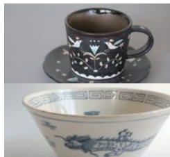
物語のあるうつわ Sakurian 林大輔 星野杏奈