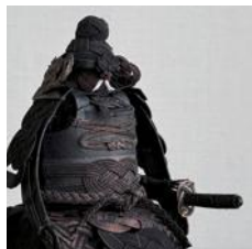
加賀水引2026 春 津田水引折型