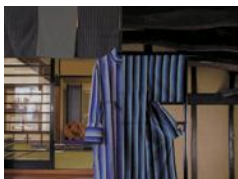
牛首紬・加賀乃織座 ~伝統と新たな挑戦~